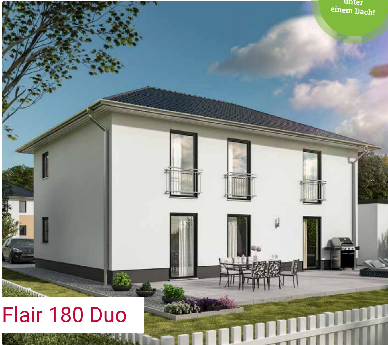
Flair 180 Duo