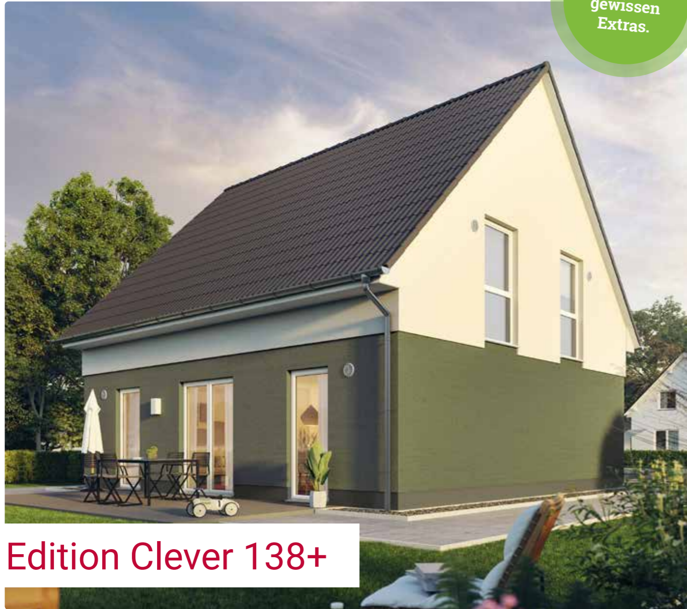
Edition Clever 138+